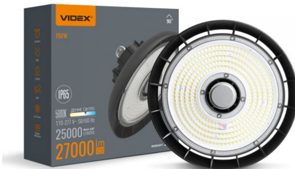
LED-Höhenlampe High Bay