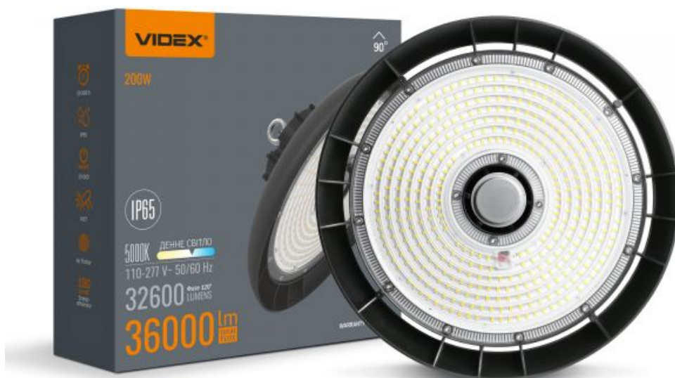
LED-Höhenlampe High Bay